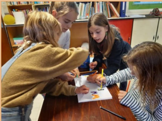
Er waren 34 jongeren aanwezig.

Op vrijdag 9 oktober konden we starten met het nieuwe werkjaar 'Geest-ig vormsel'. Die avond ging de 'smaakmaker' door.